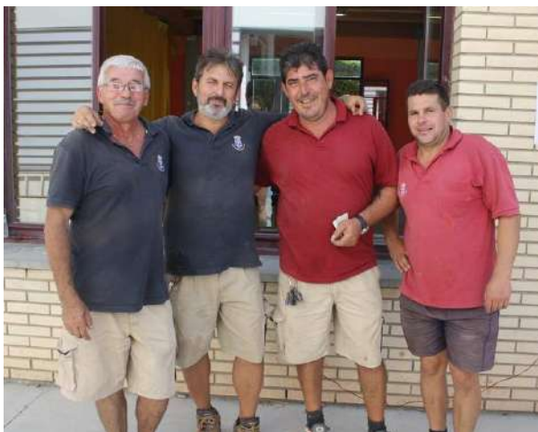
Parte del equipo de mantenimiento del Club

Este escenario produce en los trabajadores una fatiga física y mental provocada por la exigencia de un rendimiento muy superior al normal, y